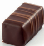
Authentique Ganache mi-amère nature