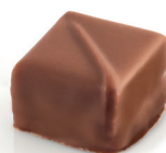
Péridot Duo gianduja et pâte d'amande