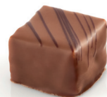
Grania Praliné noisettes torréfiées