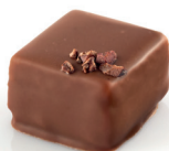
Los Angeles Praliné gruë de cacao