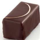
Reine Ganache mi-amère au miel