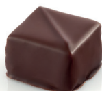
Peru Ganache Pure Origine Pérou