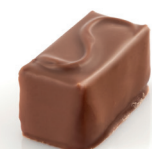
Pralino Praliné amandes et noisettes