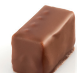
Nolwenn Praliné crêpes dentelles