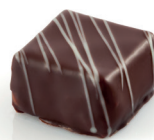
Chocagrume Ganache lactée à l'orange