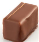
Café Gianduja pur noisettes au café