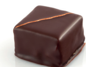
Elsa Ganache mi-amère au Marc de Gewurtz

Au coeur de l'Alsace Gourmande, la Chocolaterie Daniel Stoffel vous propose sa vitrine complète de chocolats maison Grande Tradition, pur beurre de cacao.