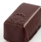
Zenith Ganache pulpe de framboise