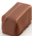
Mexico Ganache mi-amère citron vert et tequila