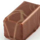
Pékin Gianduja pur noisettes à la cannelle