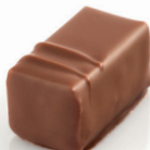
Caracas Ganache Pure Origine Vénézuëla