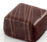
Caramande Pâte d'amande au caramel

soit 359€52 HT la sélection (+TVA 5,5% = 379,29 TTC)